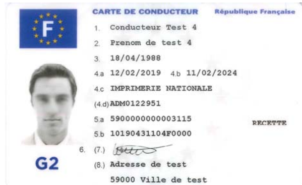
Carte de conducteur