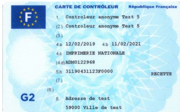
Carte de contrôleur (personne morale)