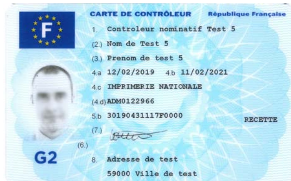
Carte de contrôleur (personne physique)